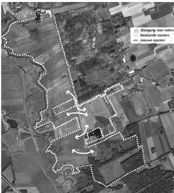
Hekken weg in de madelanden - vee over de weg