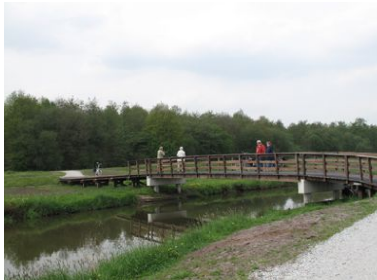
Rechts: De gemiddelde toerist kiest de brug als uitkijkpunt