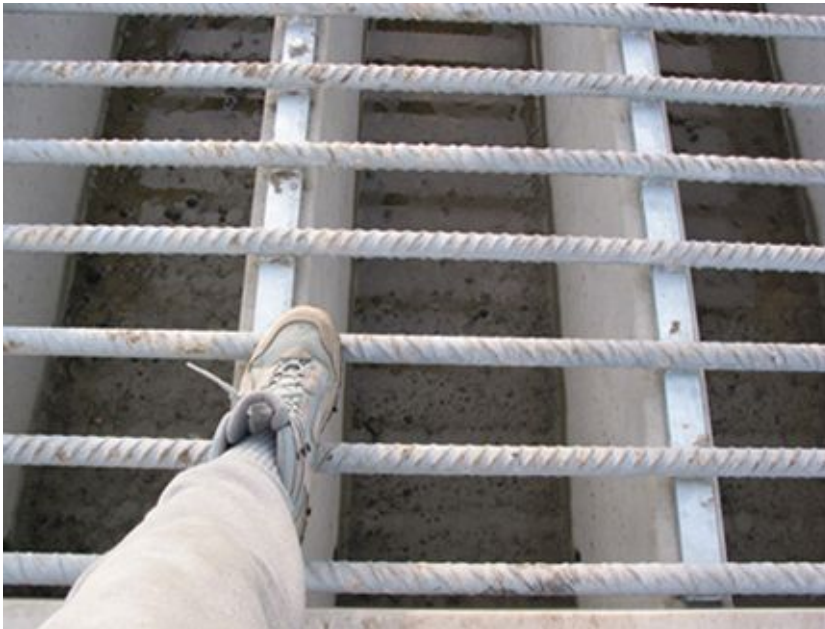
De breedte van de openingen tussen de veeroosters, vergeleken met een volwassen voet, maat 42

We hebben de maten van de openingen van de roosters bij de schietbaan nagemeten en deze bedragen 7 cm; die bij het fietspad 10 cm. Er zijn tot nu toe nog nooit problemen geweest met uitbraak van de Schotse Hooglanders uit het terrein van Natuurmonumenten. We zijn daarom benieuwd wat voor grazers SBB wil inzetten, dat er een breedte van 10 cm nodig is. Berust het gerucht, dat SBB in haar drassige terreinen waterbuffels wil introduceren, dan toch op waarheid? Wellicht kunnen de roosters, in afwachting van de komst van deze waterbuffels tijdelijk afgedekt worden, of met zand gevuld?