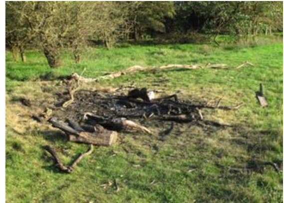
Restanten van het vuur dat begin oktober werd gestookt op de oever van de Drentsche Aa

Vanuit het NBEL wordt als commentaar geleverd dat er geen voorzieningen worden aangelegd die uitnodigen tot permanente recreatie. Zwemmen wordt niet gestimuleerd, doch wordt ook niet verboden voor anderen dan de “lokale gebruikers”. Regelmatige surveillance tijdens het zwemseizoen vindt men een goed idee en SBB zal dit in de planning opnemen.