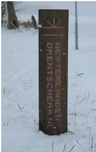
Links: wegwijzer naar de Belvédère

Doordat er op het rivierduin zelf geen aanwijzingen zijn die de exacte plaats van het uitkijkpunt preciseren, zal het effect van deze Belvédère-aanwijzer minimaal zijn. Bovendien zijn we blij dat ons een picknickbank of zit-tribune bespaard is gebleven, zoals die op andere Belvédères wel zijn geplaatst. Toch vragen we ons af waarom de Belvédère toch als zodanig is gehandhaafd. Was de folder al gedrukt en was de opdracht voor zes Belvédère-aanwijsborden reeds geplaatst? Ook de argumentatie die het NBEL in haar antwoord aanvoert, is er in onze ogen met de haren bij gesleept. Er is hier geen sprake van een “uit oogpunt van cultuurhistorie waardevol uitkijkpunt”. Het rivierduin is een aardkundig verschijnsel en heeft niets te maken met enige cultuurhistorie. In onze opvatting had dit rivierduin gespaard moeten blijven voor de vernieling die de aanleg van een fietspad met zich meebrengt en die door de aanwezige recreatie mogelijk nog kan verergeren. Gelukkig kiest de gemiddelde toerist zelf de brug als uitkijkpunt.