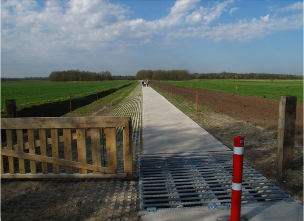
Natuurplatform Drentsche Aa

Discussie over de balans tussen natuur en recreatie