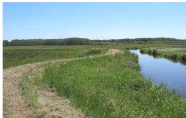
Dijk of pad?... Links, de dijk richting de Poll. Rechts, de dijk vanaf het strandje richting Vijftig Bunder